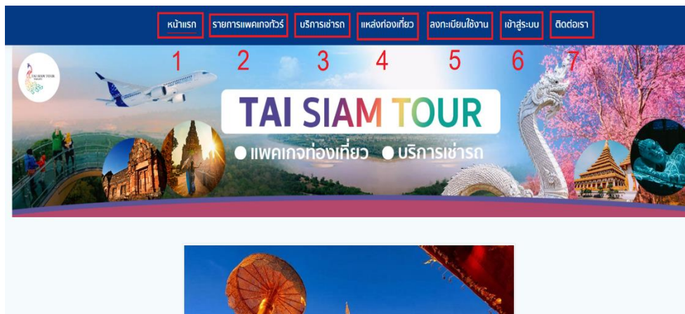
ภาพ ก.1 หน้าจอเว็บไซต์