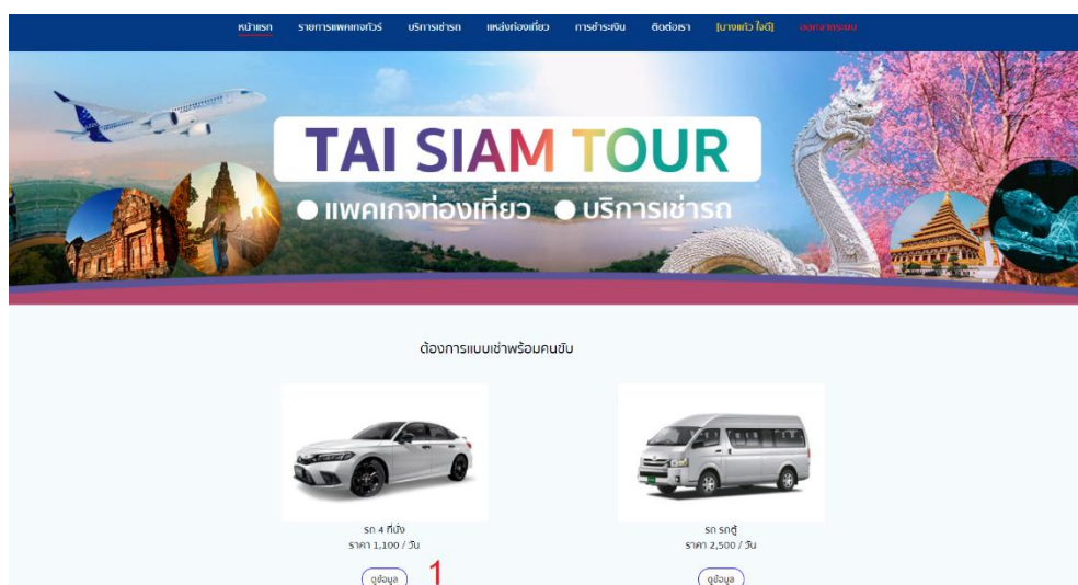
ภาพ ก.6 หน้าจอแสดงบริการเช่ารถ