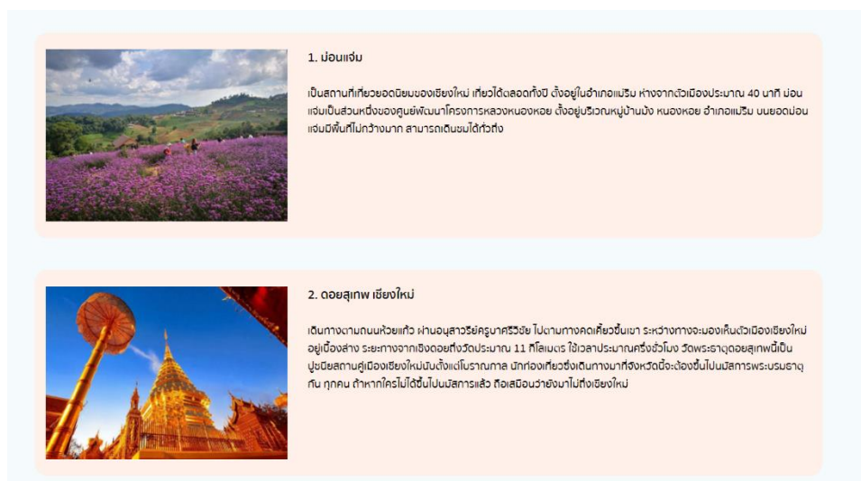
ภาพ ก.9 หน้าจอแสดงแหล่งท่องเที่ยว