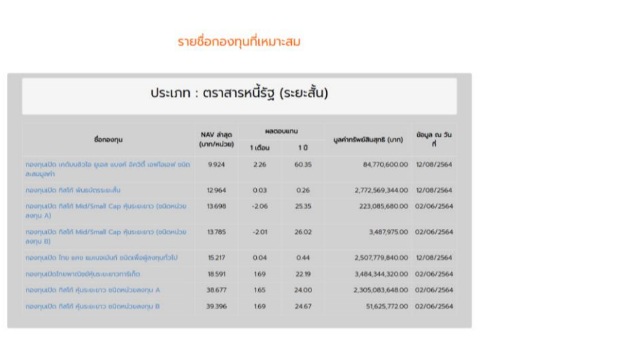
รูปที่ 4.3 แสดงหน้ารายชื่อกองทุนที่เหมาะสมกับความเสี่ยง