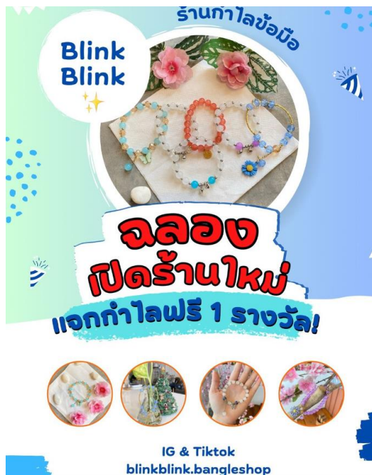
ภาพที่ ก.5 จัดกิจกรรมฉลองเปิดร้านใหม่ ทั้งแพลตฟอร์ม ดิจิทัล และอินสตาแกรม