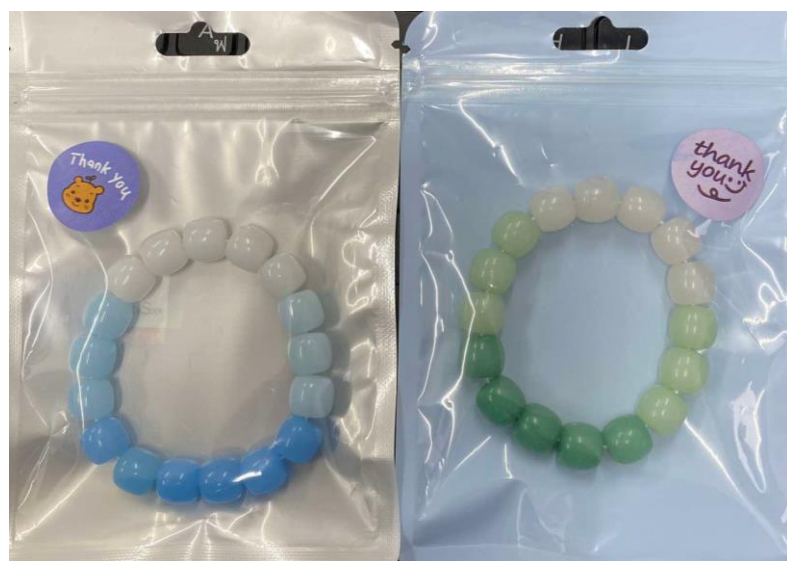
ภาพที่ ก.2 แพ็คเกจที่จัดทำขึ้นมาใหม่ของร้าน BlinkBlink