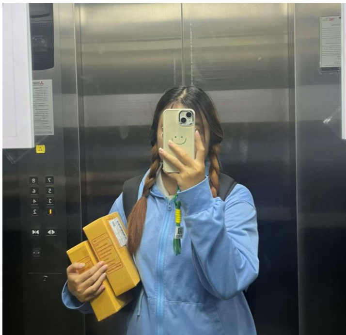
ภาพที่ ก.4 ขณะกำลังไป drop off พักที่สาขา