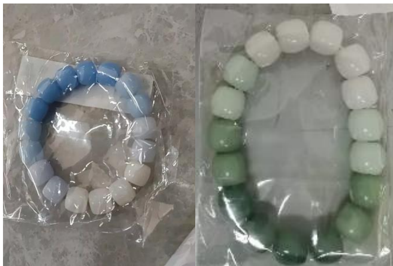
ภาพที่ ก.1 แพ็คเกจจากร้านขายส่งกำไล