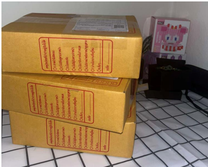
ภาพที่ ก.3 กล่องพัสดุที่พร้อมจัดส่งที่ใช้จัดส่ง