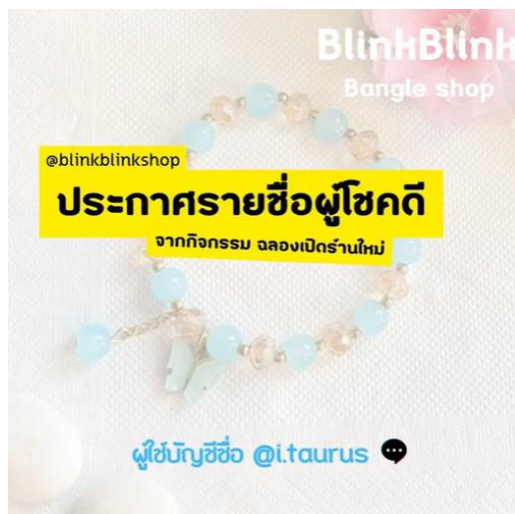
ภาพที่ ก.7 ประกาศผู้โชคดีจากกิจกรรมฉลองเปิดร้านใหม่ แพลตฟอร์ม ดิจิทัล