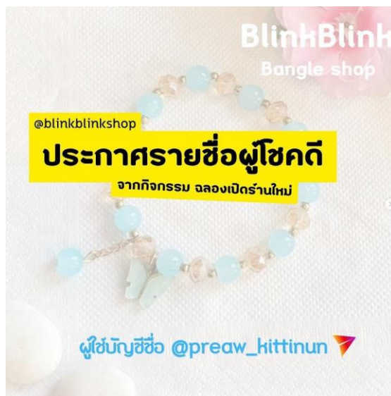
ภาพที่ ก.6 ประกาศผู้โชคดีจากกิจกรรมฉลองเปิดร้านใหม่ แพลตฟอร์มอินสตาแกรม