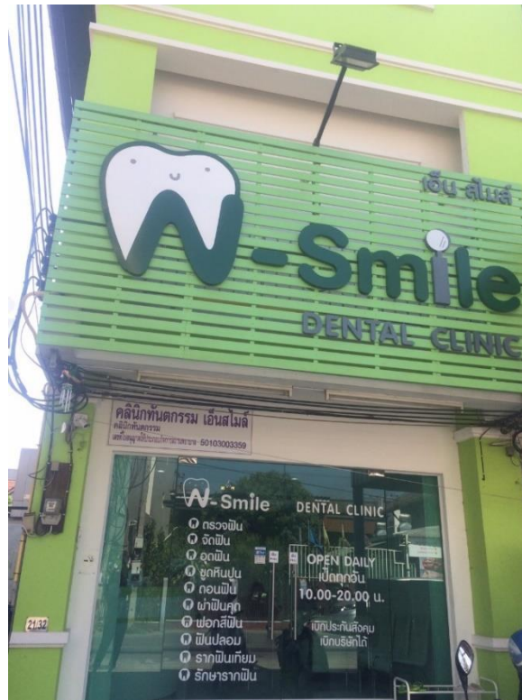
ภาพที่ ข 1.5 หน้าคลินิกทันตกรรมเฮ็นสไมล์