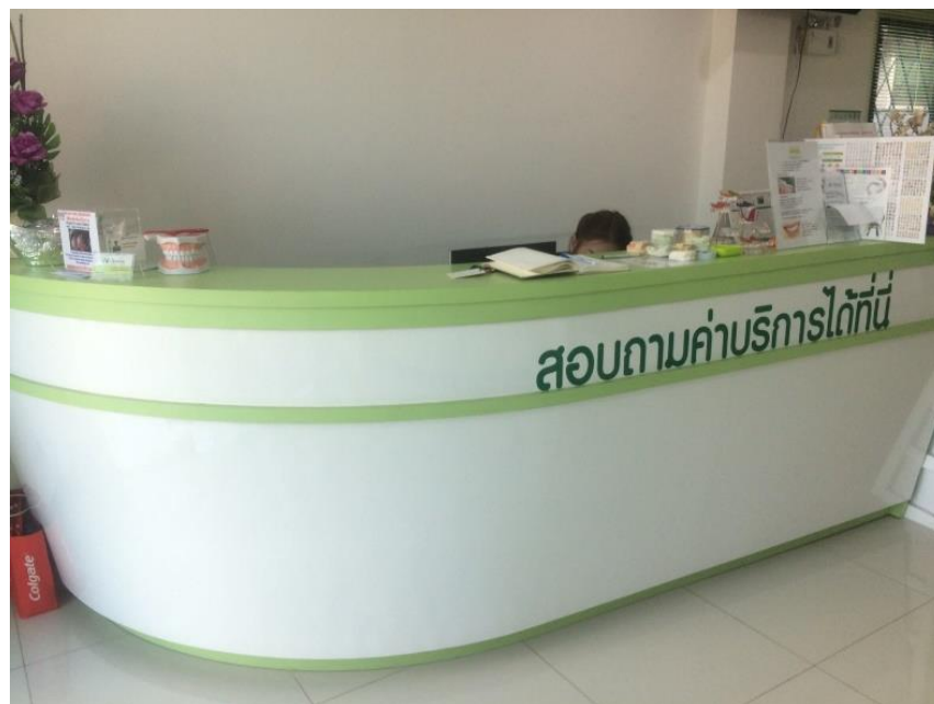
ภาพที่ ข 1.6 เคาน์เตอร์สำหรับลูกค้ามาติดต่อ