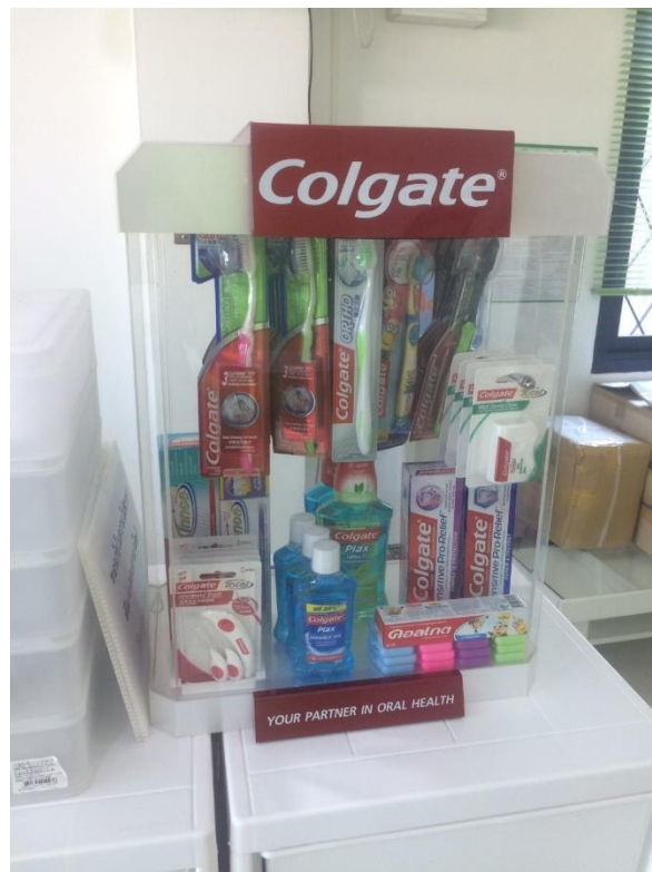
ภาพที่ ข 1.3 สินค้าทางทันตกรรมที่จำหน่ายในคลินิก