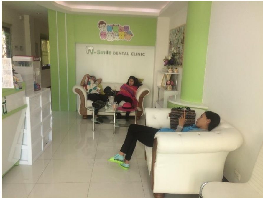
ภาพที่ ข 1.7 โซนที่ลูกค้านั่งรอรับการรักษา