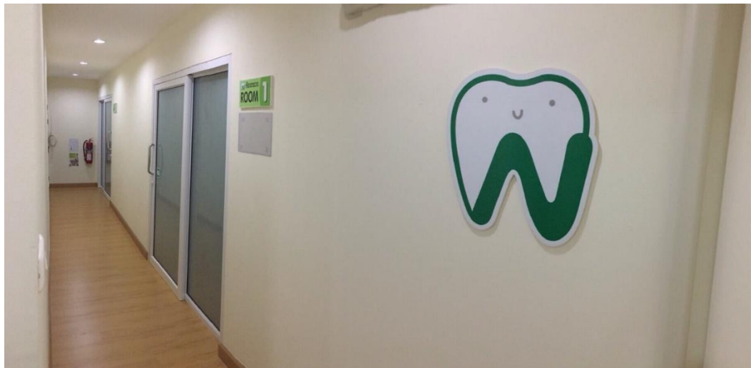
ภาพที่ ข 1.8 ห้องสำหรับที่จะเข้ารับทำการรักษา