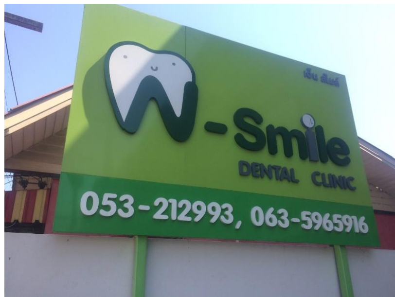
ภาพที่ ข 1.4 ป้ายหน้าร้านของคลินิก